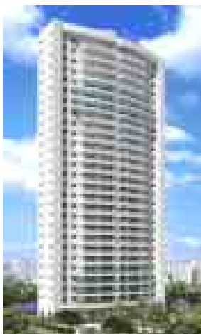
Allori São Paulo