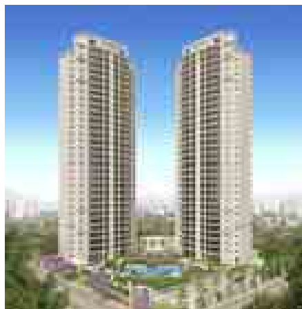
Nova Klabin São Paulo