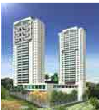
Gran Líder Olympus Minas Gerais