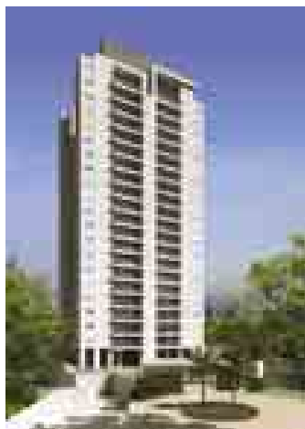
Ápice São Paulo